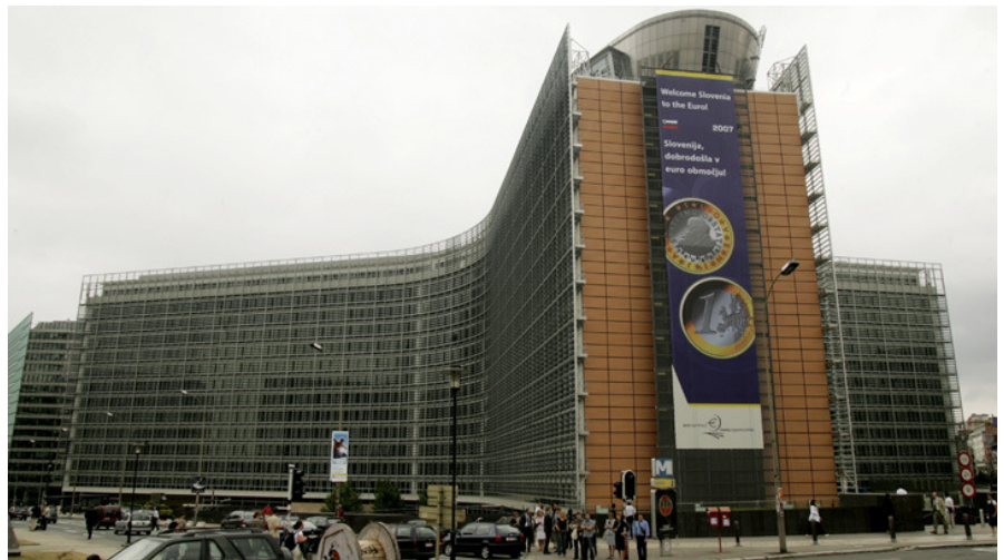
La Commission européenne, Bruxelles, Belgique.