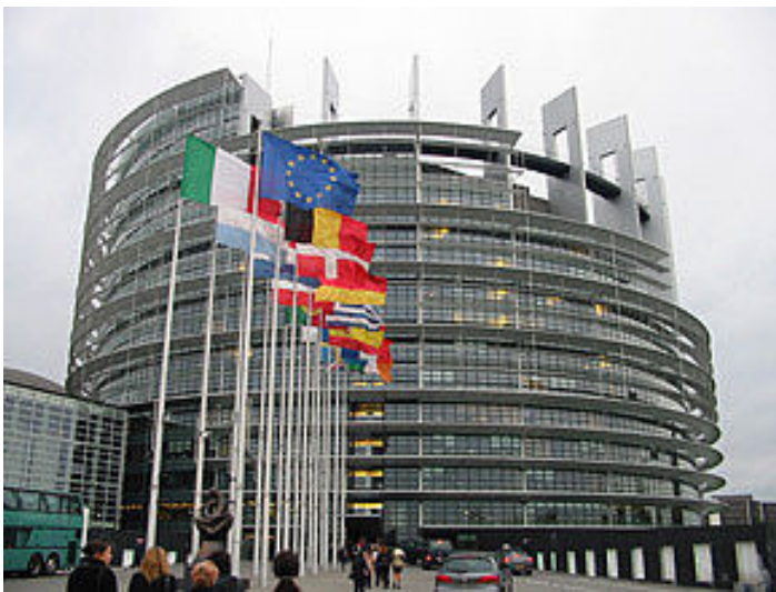
Le Parlement européen, Strasbourg, France.