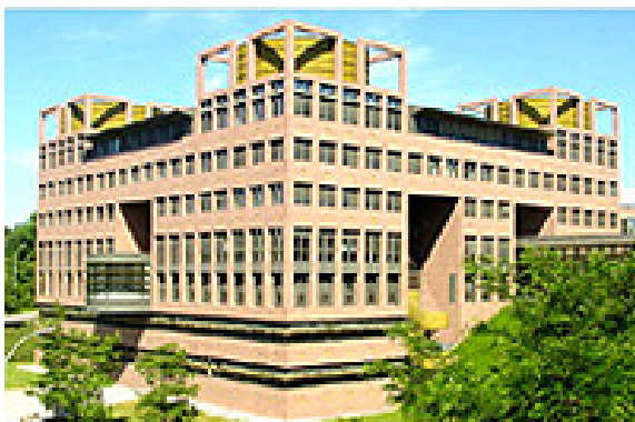
La Cour de justice de l'Union européenne, Luxembourg.