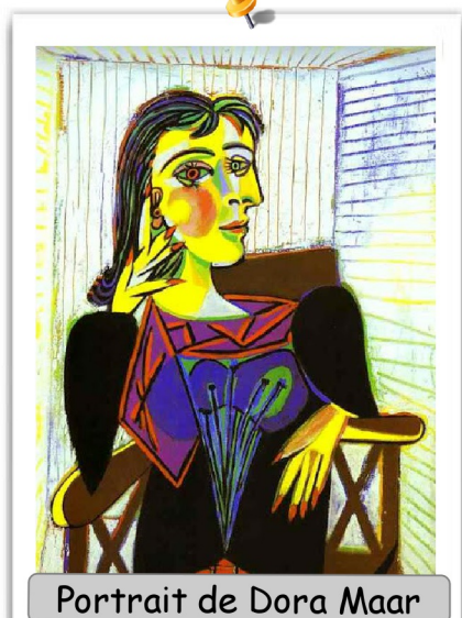
Portrait de Dora Maar

Cubisme : courant artistique né au début du XXe siècle dans lesquels les sujets sont représentés avec des formes géométriques.