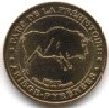
Parc de la Préhistoire Ariège Pyrénées