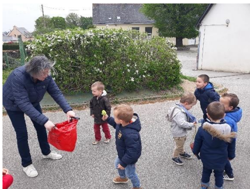
la chasse à l'œuf