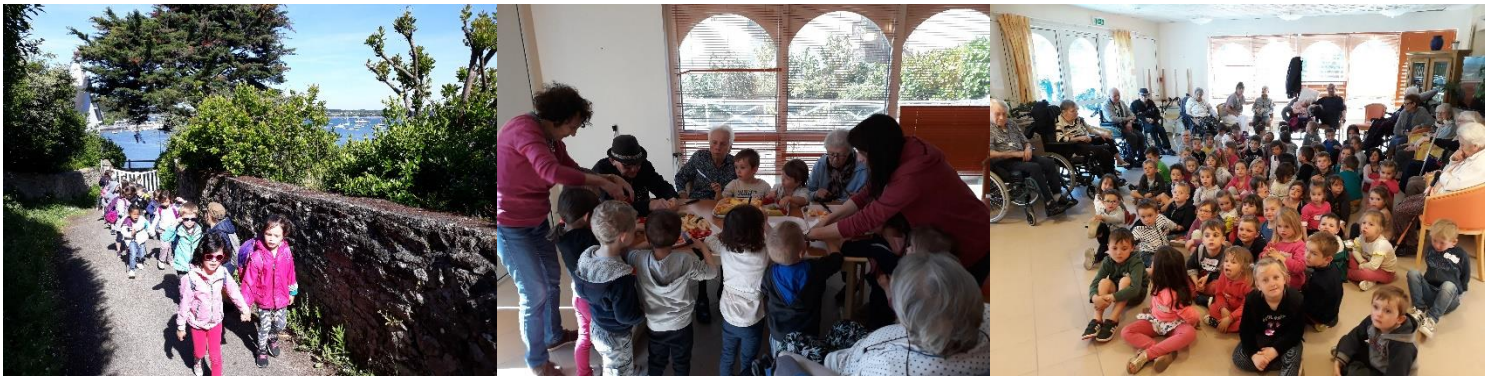
La sortie scolaire à l'Île aux Moines