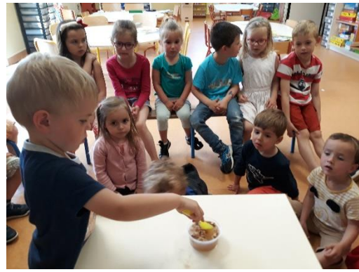
Verser, mélanger, observer : sciences autour de la dissolution.

Sans oublier les anniversaires de la période !