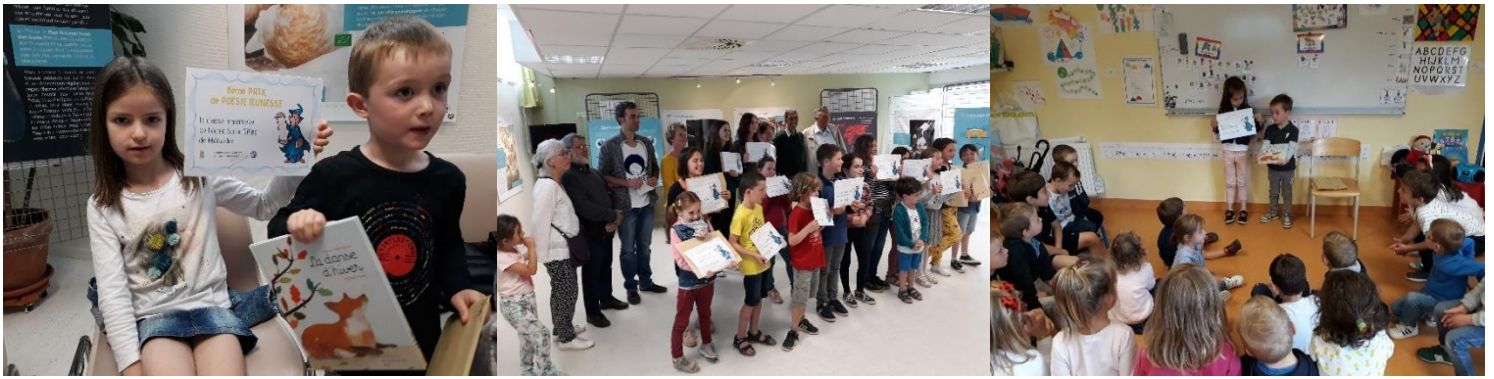
Remise des prix du concours de poésie.