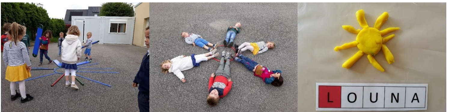
Travail autour du soleil qui nous manquait tant !