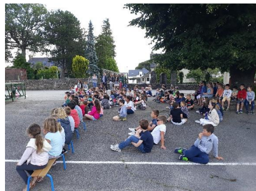
Préparation du spectacle pour la kermesse.