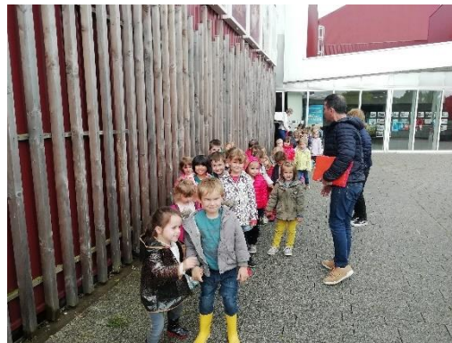
Sortie Cinécole : « Des trésors plein ma poche ».