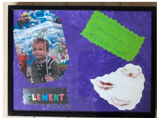
Les cadeaux des fêtes des mères et des pères