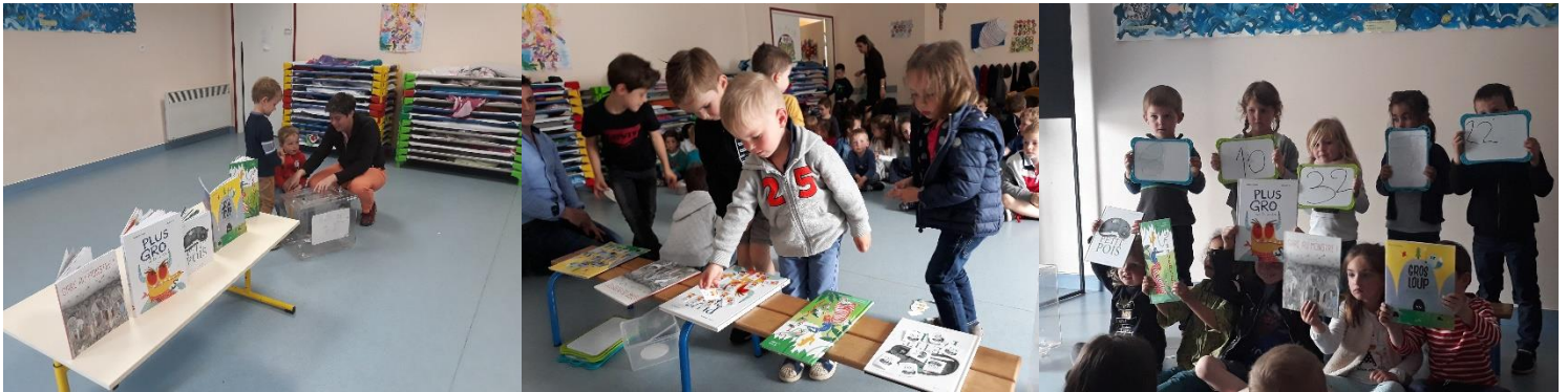
Le vote pour les Incorruptibles