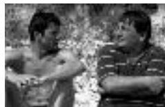
L'INCONNU DU LAC