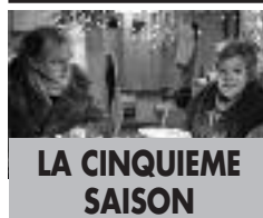
LA CINQUIÈME SAISON

de Lee Daniels USA - 2013 - 2h12 - Vo.st Avec Forest Whitaker, Oprah Winfrey, Mariah Carey Genre : Drame, Biopic