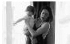
LA BATAILLE DE SOLFERINO