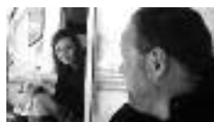
MON AMÉ PAR TOI GUÉRIE

Le jeune Cecil Gaines, en quête d'un avenir meilleur, fuit, en 1926, le Sud des États-Unis en proie à la tyrannie ségrégationniste. Tout en devenant un homme, il acquiert les compétences inestimables qui lui permettent d'atteindre une fonction très convoitée : majordome de la Maison-Blanche. C'est là que Cecil devient, durant sept présidences, un témoin privilégié de son temps.