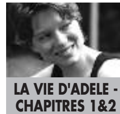
LA VIE D'ADELE - CHAPITRES 1 & 2