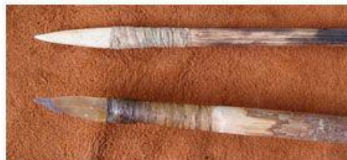
Pointes de sagaie en bois de renne et silex (reproductions de Florent Rivère)

(images de http://ticayou.canalblog.com/ )