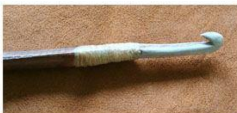
Crochet de propulseur en bois de renne (reproduction de Florent Rivère)