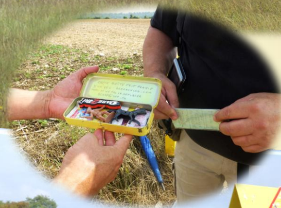
Géocaching : Et Une !!!