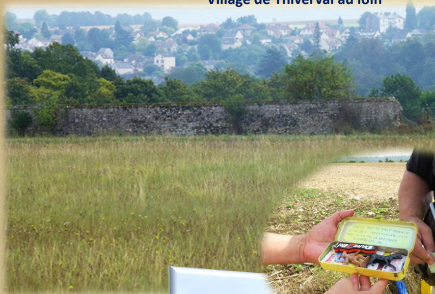
Village de Thiverval au loin