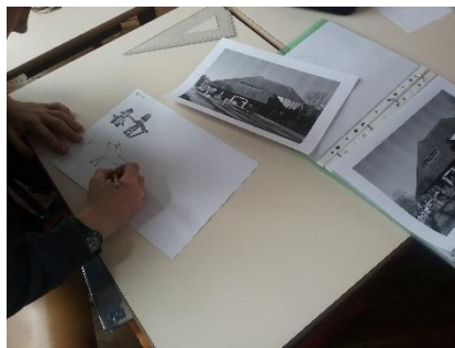
Dessins sur des reproductions des cartes postales anciennes.