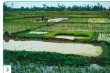
une rizière en Inde

Le bocage est une région de prés et de champs entourés de haies.