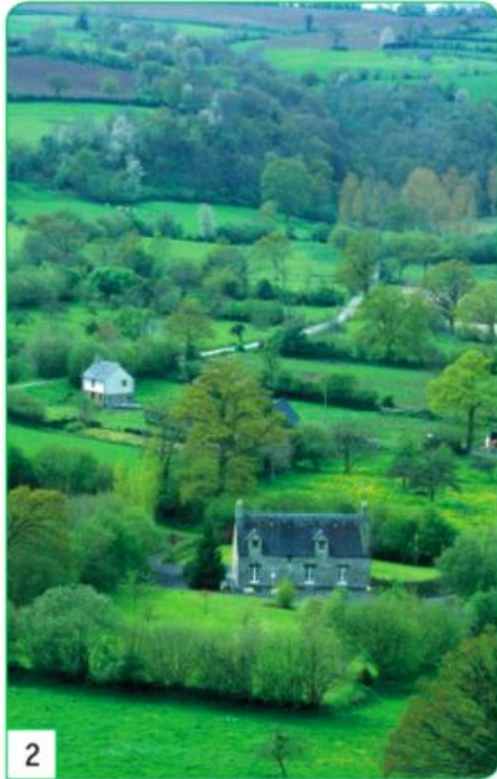
2 un bocage en France

Comparer le bocage (photo 2) à la rizière (photo 3) : faire remarquer la présence de l'eau, les types de cultures. Puis, lire les définitions du bocage puis de la rizière