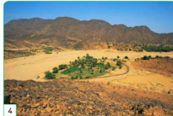
4 une oasis au Niger

Puis, on voit une oasis sur la photo 4 (= endroit du désert où il y a de l'eau et de la végétation, dans les déserts de sable, en Afrique principalement).