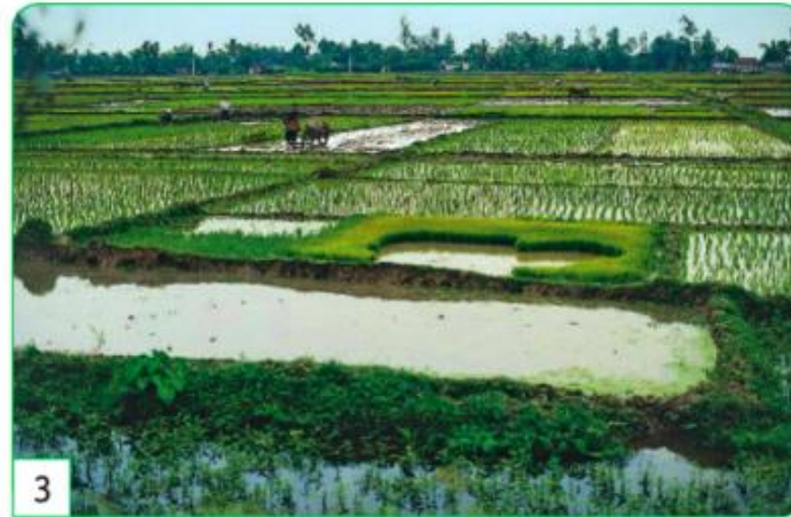
3 une rizière en Inde

Le bocage est une région de prés et de champs entourés de haies.