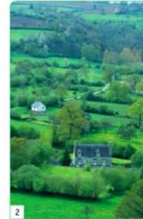
un bocage en France

Le bocage est une région de prés et de champs entourés de haies.