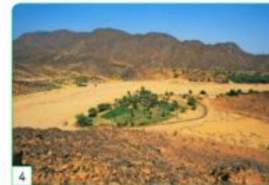
une oasis au Niger

La rizière est un champ où l'on cultive le riz.