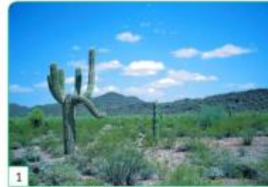
un désert aux États-Unis

Observe et décris ces différents paysages.