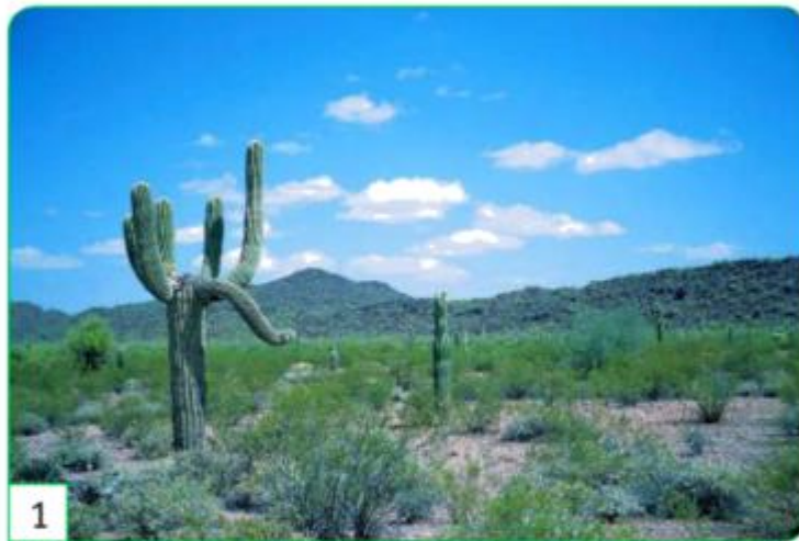
1 un désert aux États-Unis