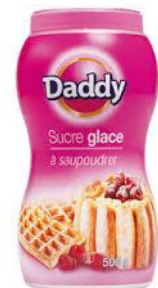
125 g sucre glace