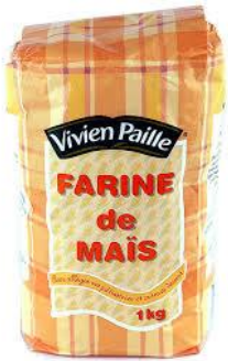
100 g farine de maïs