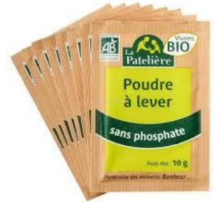
deux cuillères de levure