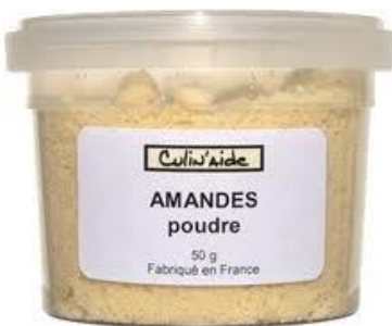
200 g la poudre d'amande