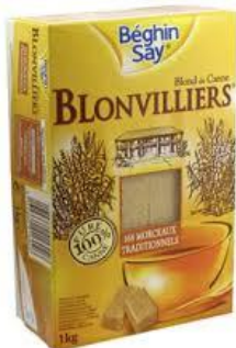
125 g sucre de canne