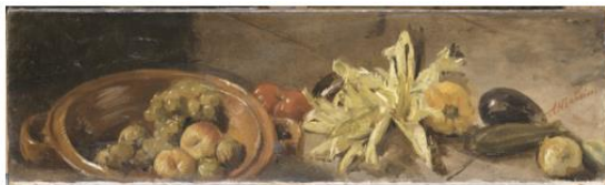
Nature morte, Antonio Mancini, musée d'Orsay