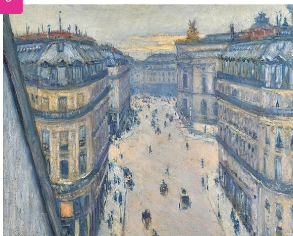
Rue Halévy, vue du sixième étage, Gustave Caillebotte, 1878, collection particulière