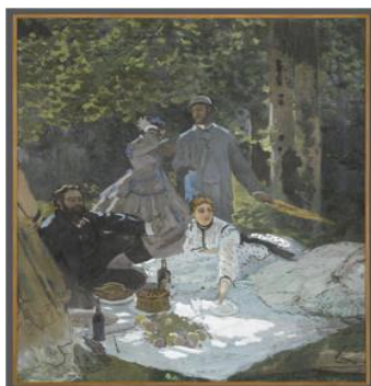
Le déjeuner sur l'herbe, à Chailly, Claude Monet, musée d'Orsay