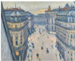
Rue Halévy, vue du sixième étage, Gustave Caillebotte, 1876, collection particulière

Les tableaux suivants ne représentent pas des paysages. On les appelle :