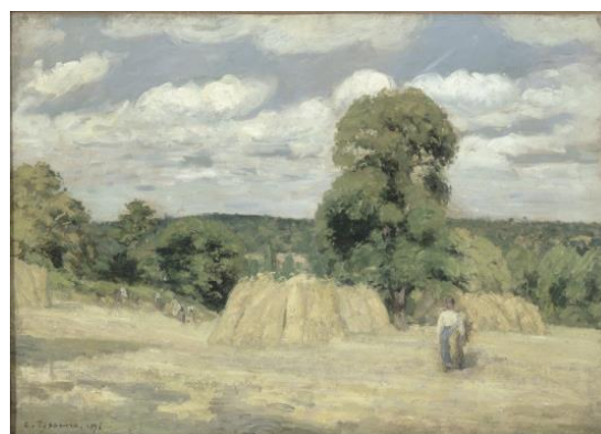
Moisson à Montfoucault, Camille Pissarro, 1875, musée d'Orsay