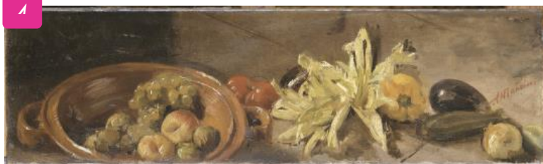
Nature morte, Antonio Mancini, musée d'Orsay