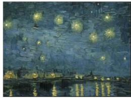
Nuit étoilée sur le Rhin, Van Gogh, 1888, musée d'Orsay