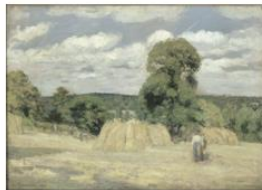
Araban à Montfaucon, Camille Pissarro, 1872, musée d'Orsay