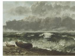
La mer argente, 1870, Gustave Courbet, musée d'Orsay