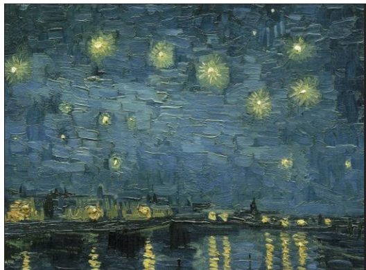
Nuit étoilée sur le Rhône, Van Gogh, 1888, musée d'Orsay

Dans toutes ces reproductions, entoure celles qui pour toi représentent un paysage :