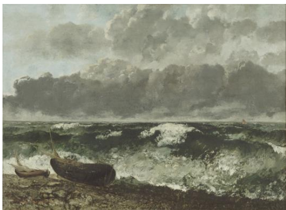
La mer orageuse, 1870, Gustave Courbet, musée d'Orsay