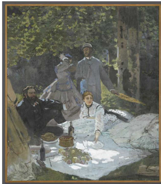
Le déjeuner sur l'herbe, à Chailly, Claude Monet, musée d'Orsay