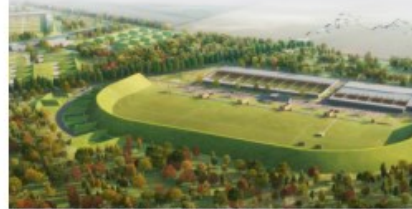
le CNTS est la seule installation sportive civile capable d'accueillir au niveau européen toutes les disciplines du tir entre 10 et 600 mètres.

Situé au centre de la France, à moins de trois heures de Paris, il est facilement accessible par la route et par le rail. Il est également situé à proximité de l'aéroport de Châteauroux.