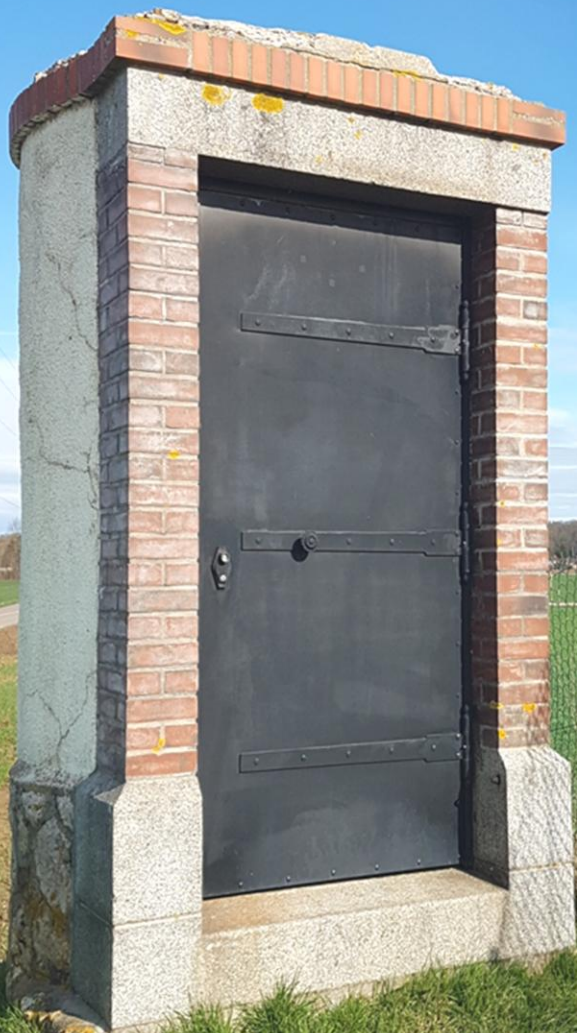
L'Aqueduc de l'Avre à Villiers-le-Mahieu