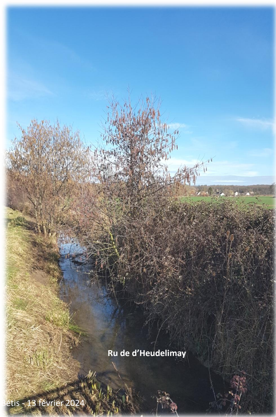
Ru de d'Heudelimay