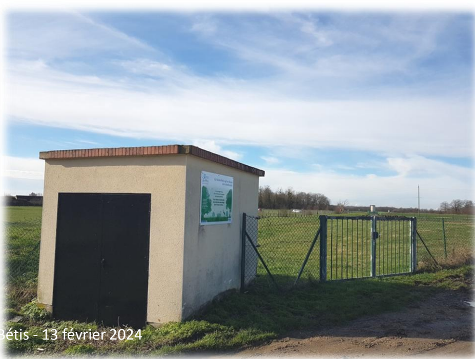
Montage d'Emérance Bétis - 13 février 2024