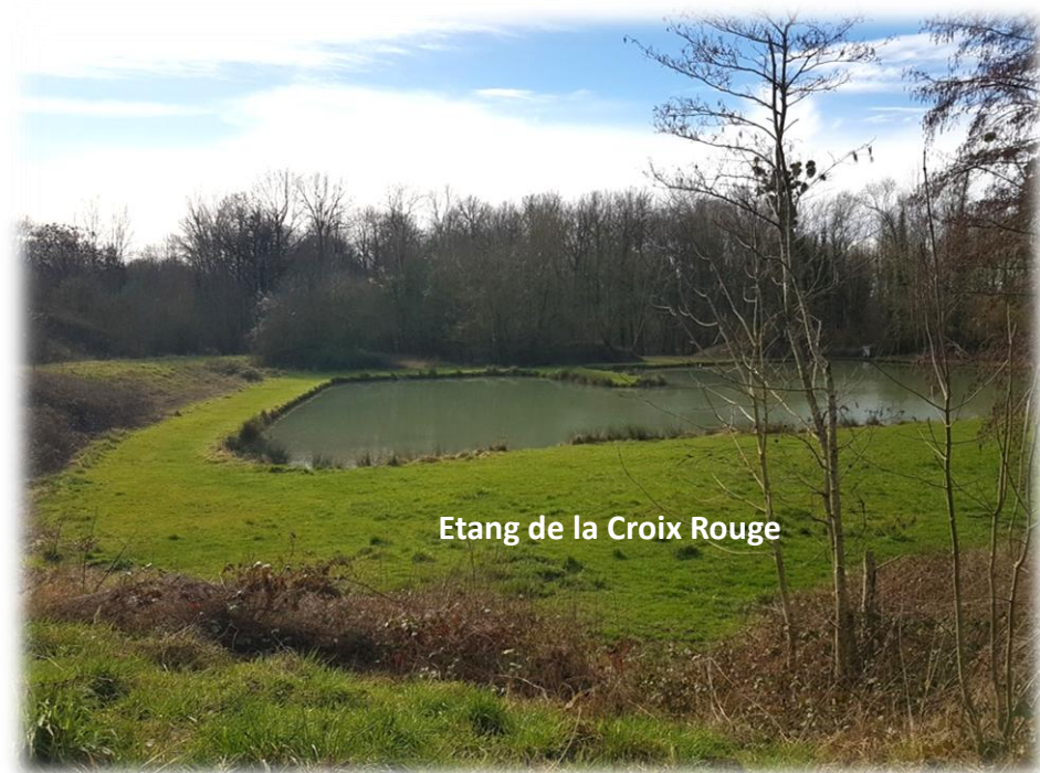
Etang de la Croix Rouge