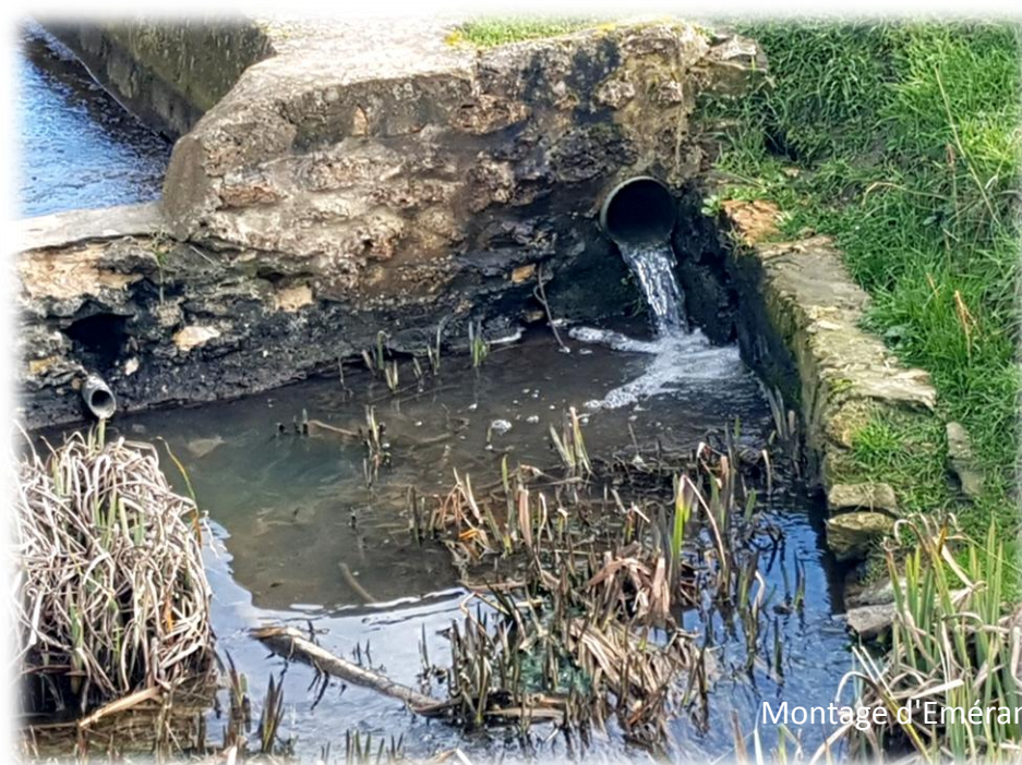
Montage d'Emeraude Bétyis - 13 février 2024