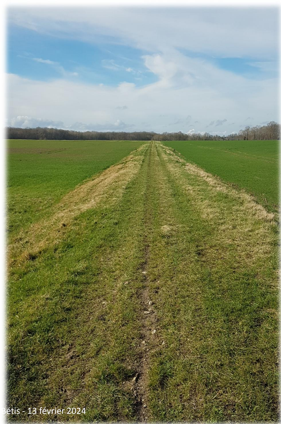
Montage d'Emerance Bétis - 13 février 2024