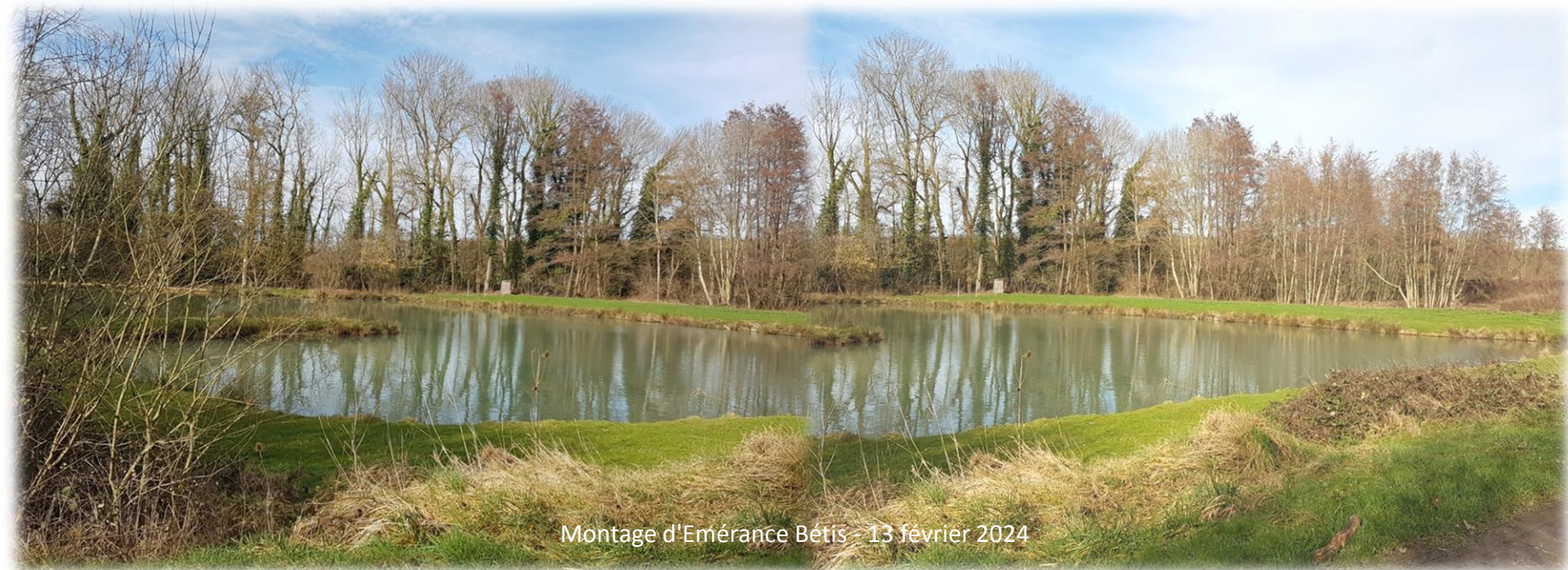
Montage d'Emerance Bétis - 13 février 2024