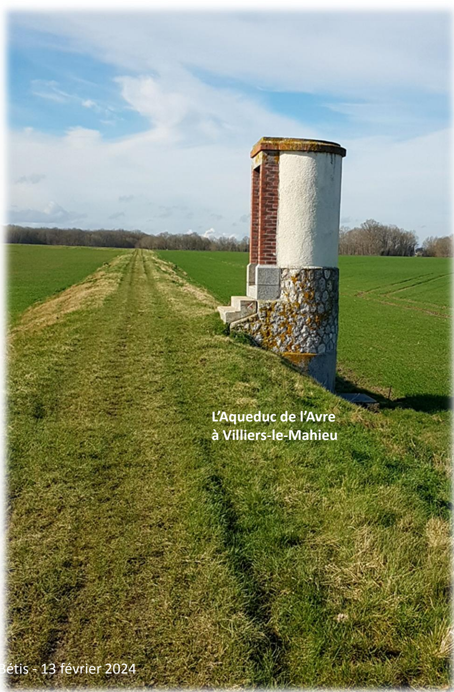
L'Aqueduc de l'Avre à Villiers-le-Mahieu