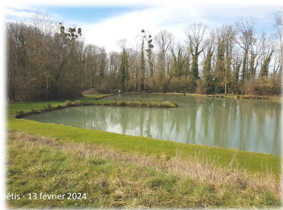
Montage d'Emerance Bétis - 13 février 2024