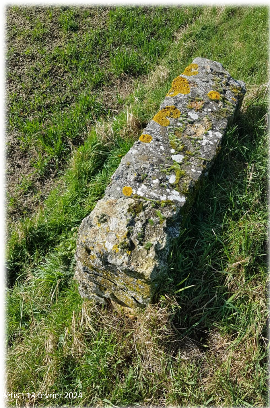
Montage d'Emerance Bétyis - 13 février 2024