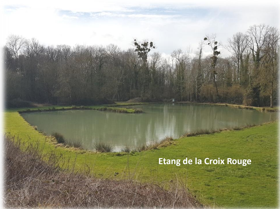
Etang de la Croix Rouge