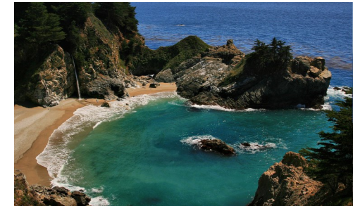
une anse ou une crique