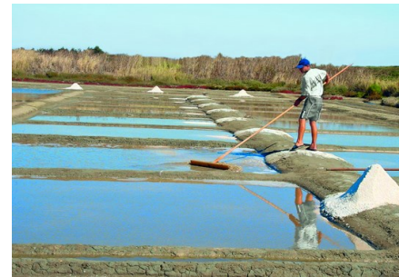
des marais salants