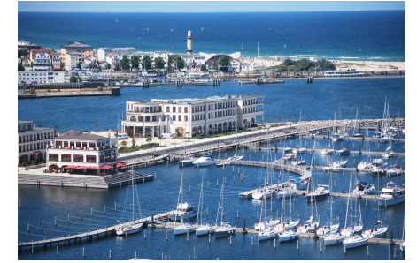
un port de plaisance