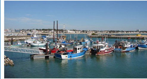
un port de pêche