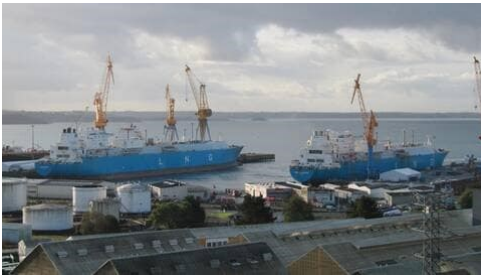
un port de commerce