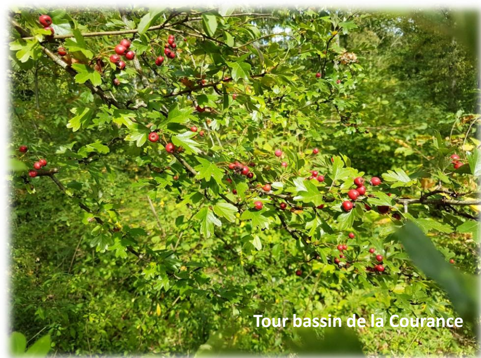
Tour bassin de la Courance