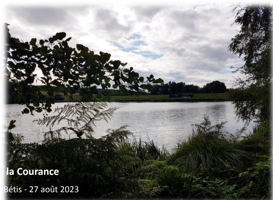
Tour bassin de la Courance Montage d'Emérance Bétis - 27 août 2023