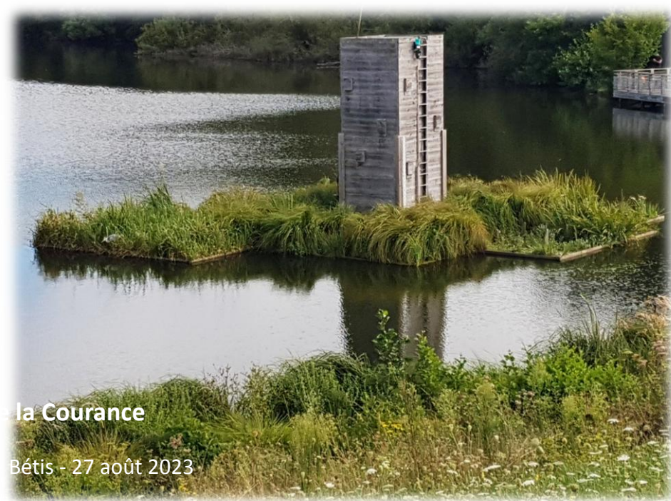
Tour bassin de la Courance