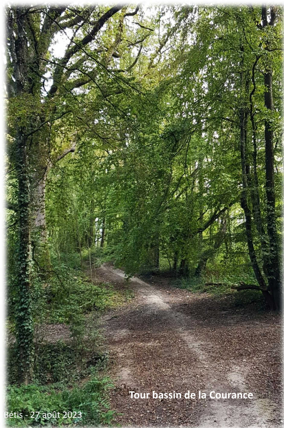
Tour bassin de la Courance