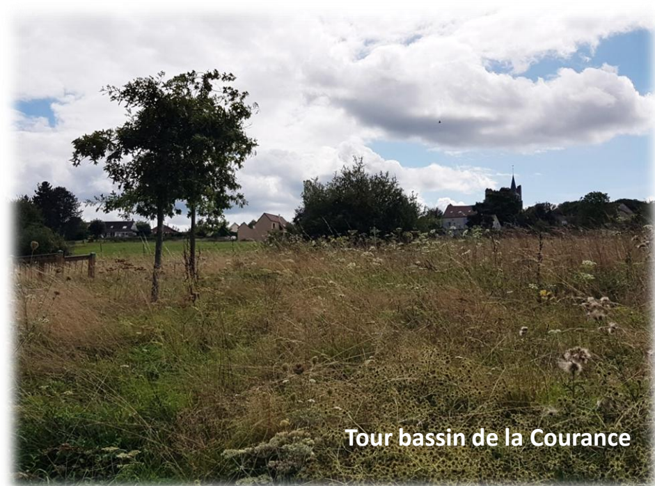
Tour bassin de la Courance