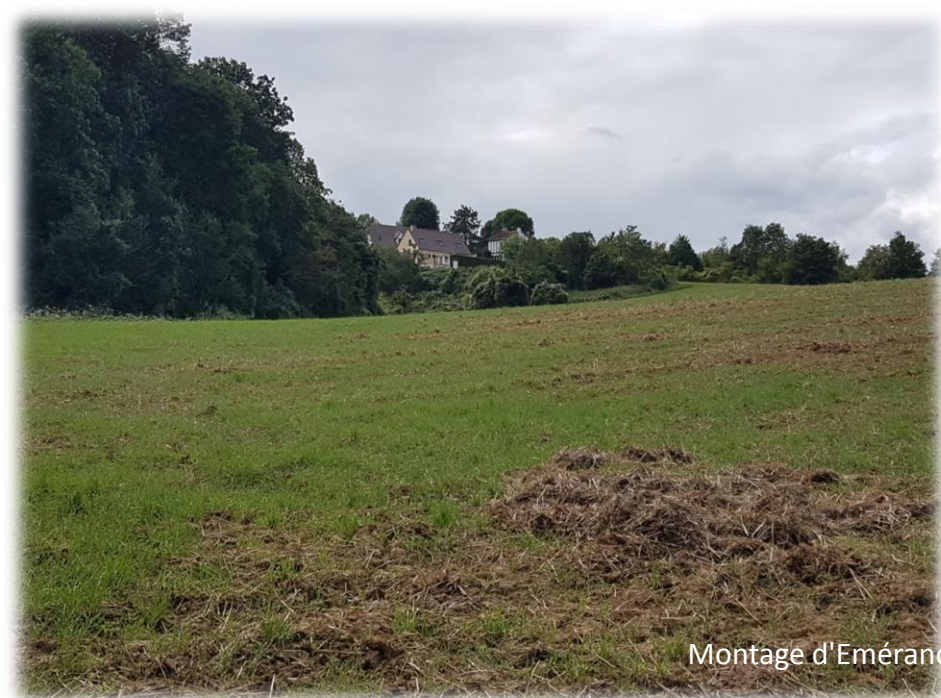
Montage d'Emérance Bétis - 27 août 2023