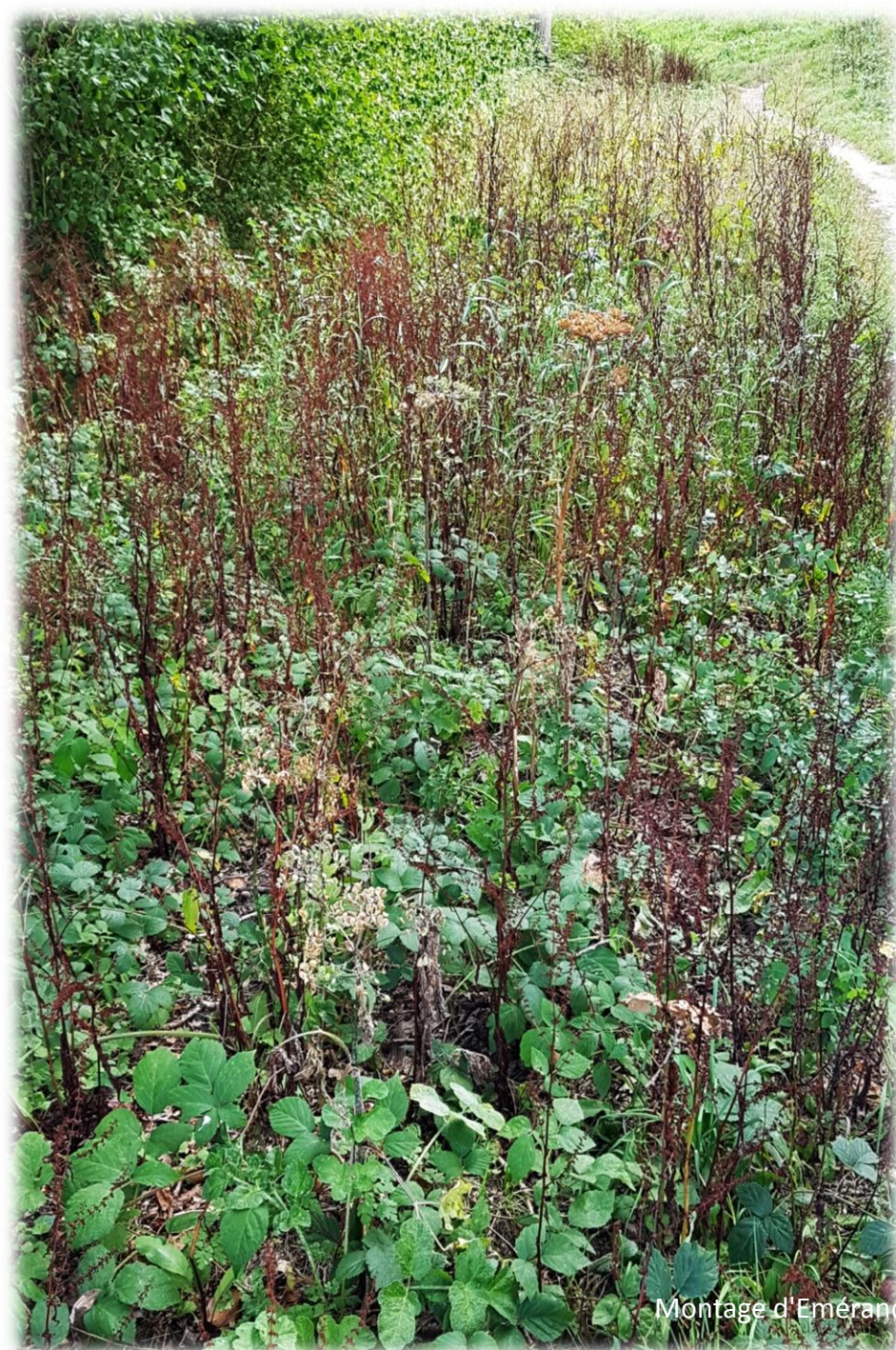
Montage d'Émerance Bétis - 27 août 2023