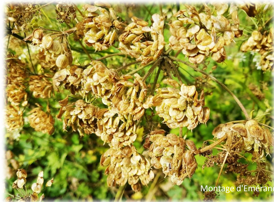
Montage d'Émerance Bétis - 27 août 2023