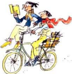
7. le droit de lire n'importe où