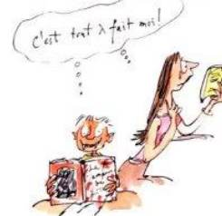
6. le droit au bovarysme