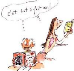
6. le droit au bovarysme