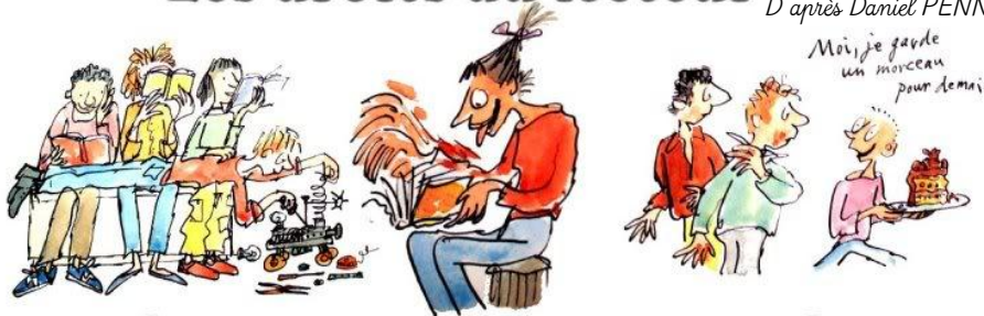
1. le droit de ne pas lire