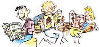
5. le droit de lire n'importe quoi