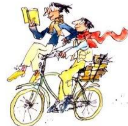
7. le droit de lire n'importe où