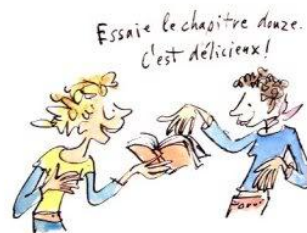
8. le droit de grapiller