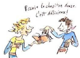
8. le droit de grapiller