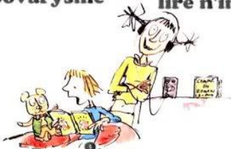
9. le droit de lire à voix haute