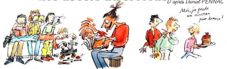
1. le droit de ne pas lire