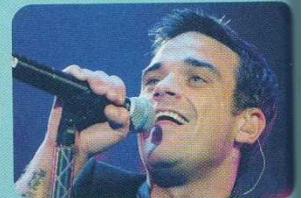
J. Robbie Williams anglais, 32 ans, pop.