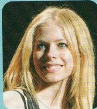
H. Avril Lavigne canadienne, 22 ans, pop.