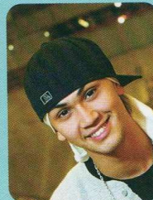
D. Billy Crawford américain, 24 ans, r'n'b.