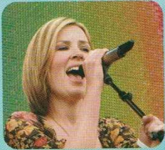
A. Dido anglaise, 35 ans, rock-folk.