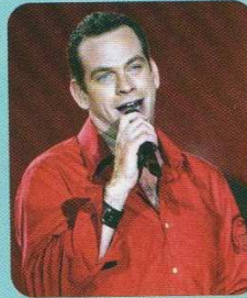
I. Garou canadien, 34 ans, variété (pop).