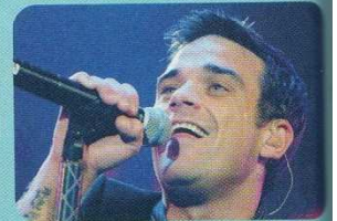
J. Robbie Williams anglais, 32 ans, pop.