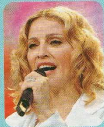
G. Madonna américaine, 48 ans, pop.