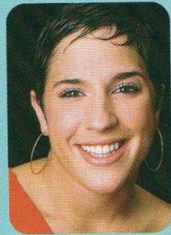
B. Diam's française 26 ans, rap.