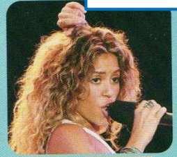
E. Shakira colombienne, 29 ans, r'n'b.