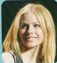
H. Avril Lavigne canadienne, 22 ans, pop.