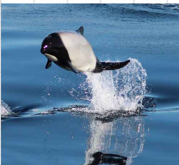
< Dauphin de Commerson Manchots empereurs >