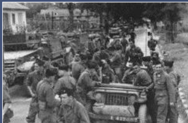
Cliché de la jonction...

Aussitôt, tous les villageois arrivèrent pour voir le capitaine GUERARD**, de la 1 ère D.F.L, au pied d'un orme centenaire, réalisant ainsi la jonction entre les forces alliées débarquées, d'une part le 17 août en Provence et d'autre part le 6 juin 1944** en Normandie » (...)