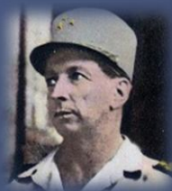
Général BROSSET Commandant la 1 ère D.F.L

Le 12 septembre 1944, à Nod-sur-Seine (Côte d'Or), le détachement d'Alain Savary (1 er peloton du 2 e escadron) du 1 er Régiment de Fusiliers Marins de la 1 ère D.F.L, débarqué à Cavalaire dans le cadre de l'opération Dragoon le 16 août 1944, fait la jonction avec des éléments du 1 er Régiment de Marche des Spahis Marocains et du 12 ème Cuir de la 2 ème D.B. du général Leclerc, ayant traversé la France depuis la Normandie et libéré Paris.