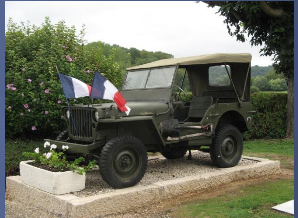
Jeep 1 ère D.F.L Half-track « Tchad » 2 e D.B