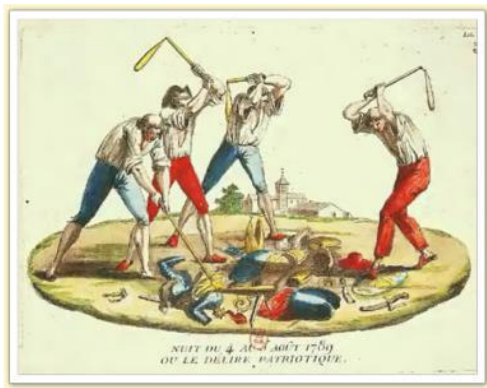
Abolition des privilèges