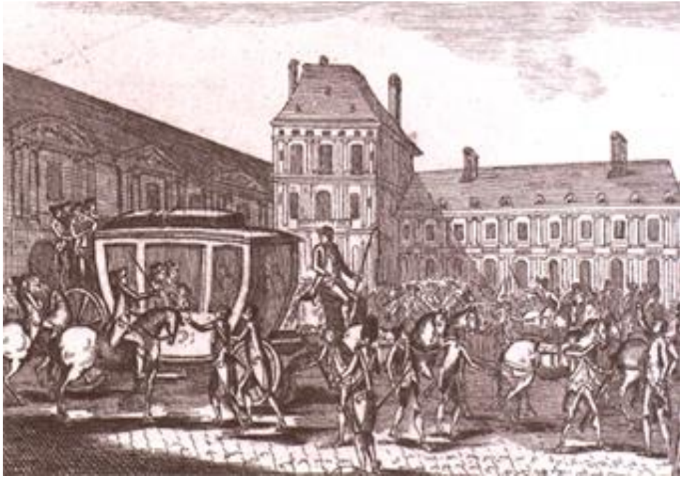
La fuite du roi Louis XVI