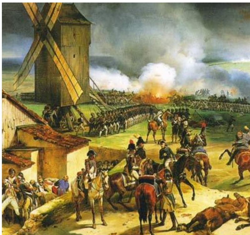
La bataille de Valmy