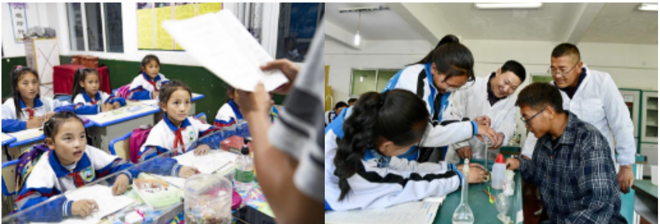
A gauche : Des élèves suivent un cours dans la ville de Qamdo de la région autonome du Tibet, le 14 septembre 2020. A droite : Un enseignant du Hubei et un enseignant local dirigent des élèves dans une expérience de chimie au lycée n° 1 de Shannan, dans la région autonome du Tibet, le 7 mai 2019.

A l'inverse, l'enseignement supérieur chinois est prioritairement axé sur le développement accéléré des sciences et techniques et est donc directement orienté vers l'effort de montée en gamme technologique tous azimuts du pays ! Pour la jeunesse chinoise fraîchement diplômée, l'incertitude du lendemain est aujourd'hui un sentiment inconnu. Quant aux étudiants et aux jeunes diplômés occidentaux, leur perspective générale se résume aujourd'hui en ces quelques mots : précarité et chômage croissants !