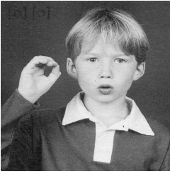
Les doigts forment un O.