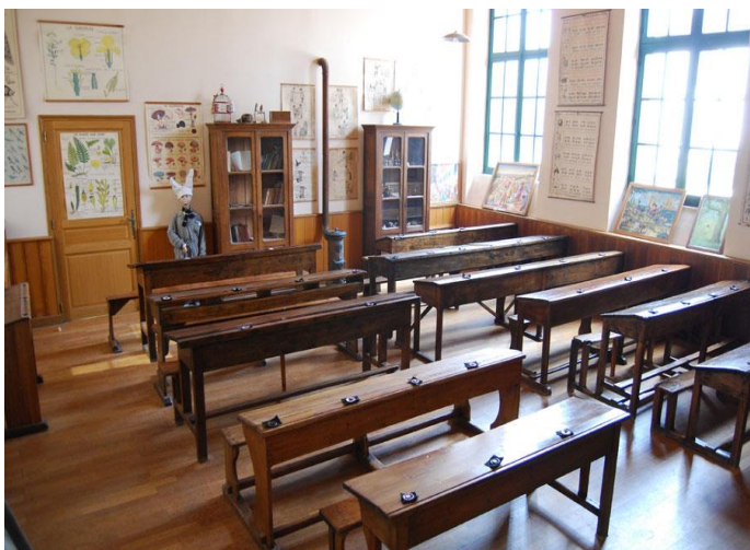
une classe en 1900