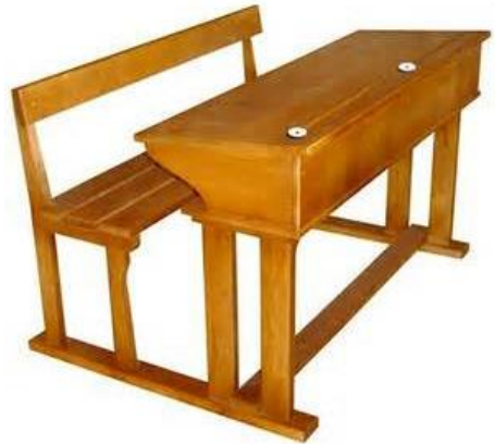
un pupitre - un pupitre