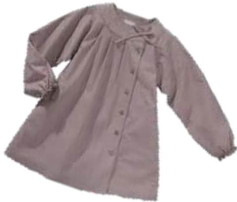
une blouse - une blouse