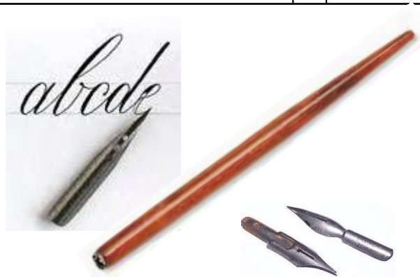
des plumes Sargent Major et un porte-plume