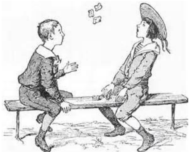
Ils jouent. - Ils jouent.