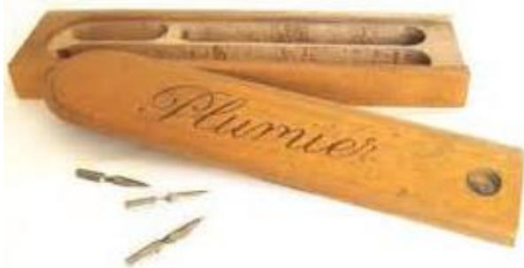
le plumier - le plumier