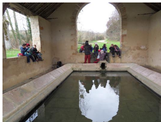
Lavoir des Chenèvres