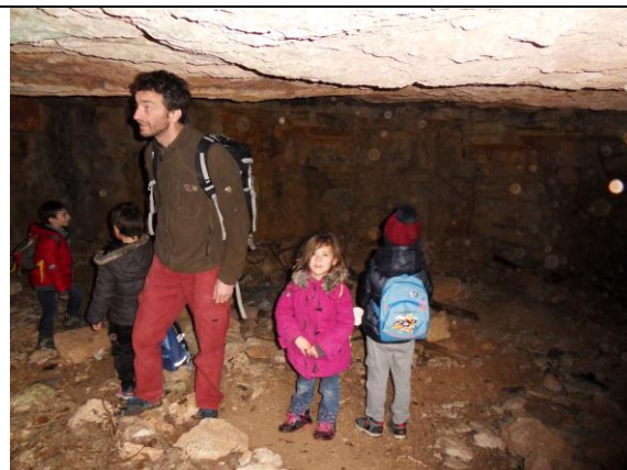
La grotte au-dessus du Clos Salomon