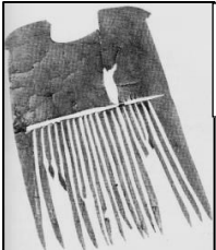
Peigne à tisser vieux de 2500 ans