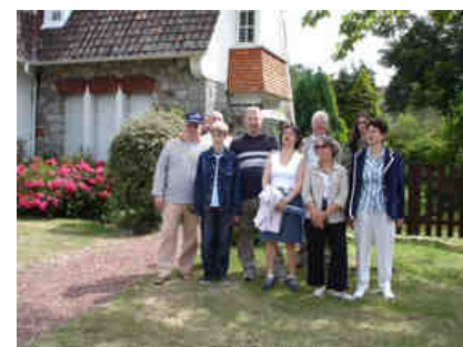
Villa « Marjolaine » à Stella

Des sorties hors programme sont organisées à la demande pour les groupes et les particuliers. Nous sommes membres du réseau des Greeters'62 en partenariat avec le Comité Régional du Tourisme.