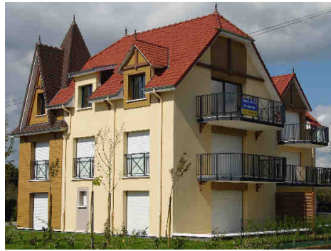
Angle rue de Londres, rue de Saint-Quentin à Stella-Plage.

D'autres réaffirment le style souvent adopté pour les immeubles de Stella-Plage.