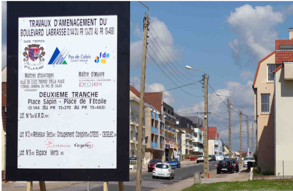
La métamorphose de boulevard Labrasse sera bientôt terminée.