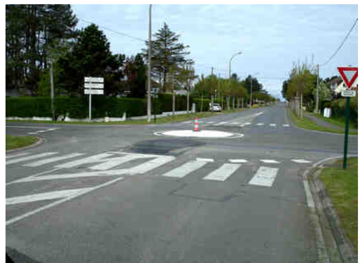
Le nouveau giratoire créé dans le carrefour modifié boulevard de Berck – boulevard de France