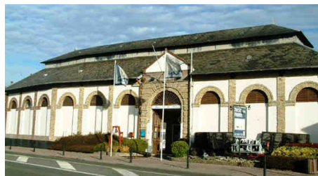
Musée de la marine à Etaples

Les cinq musées du Montreuillois qui vous accueillent :