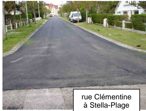
rue Clémentine à Stella-Plage

Le financement de ces travaux de réfection de chaussées à Stella-Plage provient du « trésor de guerre » de l'ex-ASAP (Association Syndicale Autorisée des Propriétaires), dissoute en 2004 grâce à l'action menée à l'époque par la seule association STELLA 2000 - devenue CTS 2020 - pour la suppression de la taxe syndicale et la dissolution de l'ASAP.