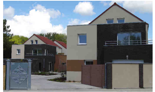
Entrée de Cucq en venant de Merlimont sur la RD 940.