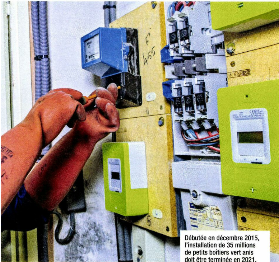
Débutée en décembre 2015, l'installation de 35 millions de petits boîtiers vert anis doit être terminée en 2021.

existants pour transporter des données. La fréquence pour Linky est à 75 kHz. Est-ce dangereux? L'association Robin des Toits soutient que oui. Elle explique que le réseau électrique a été conçu pour supporter un courant à 50 Hz, pas une fréquence à 75 kHz. Selon eux, l'ajout de la fréquence ferait « rayonner tout le réseau » en permanence.