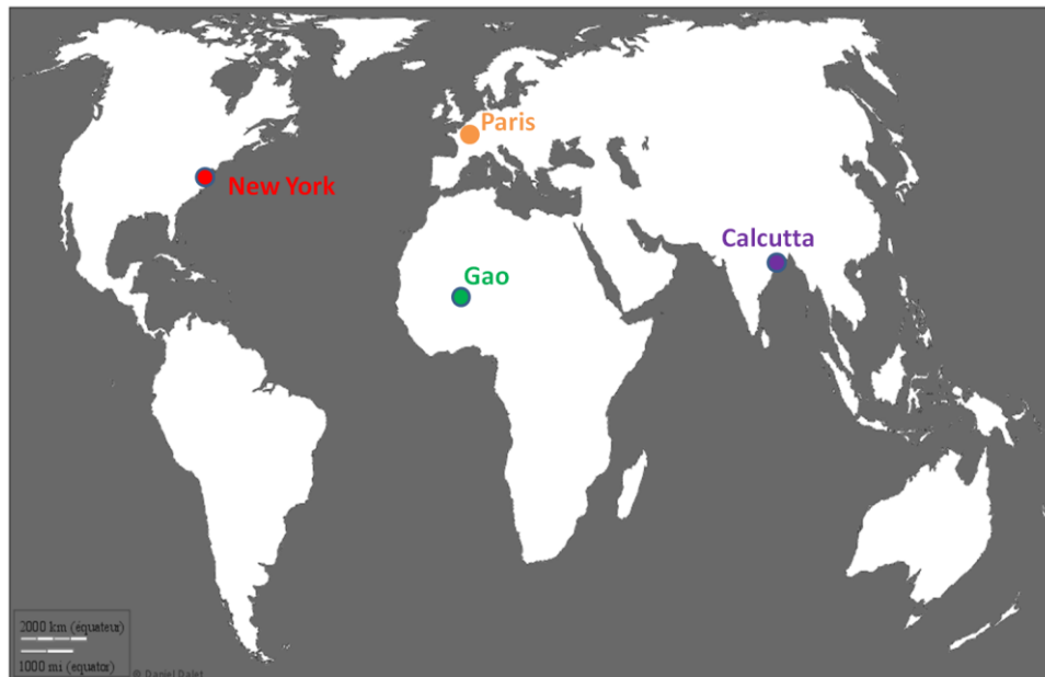
Fiche 1 : Se déplacer dans un autre lieu du monde