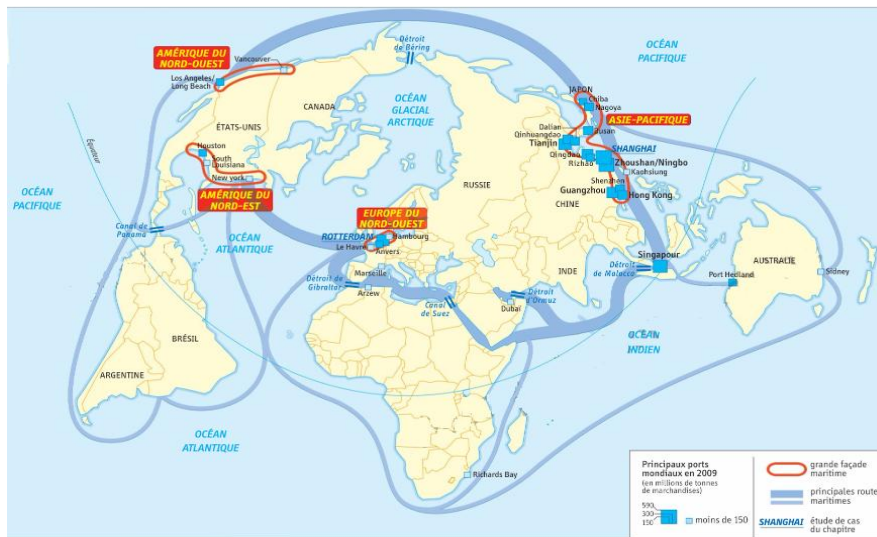
Fiche 2 : Se déplacer dans un autre lieu du monde