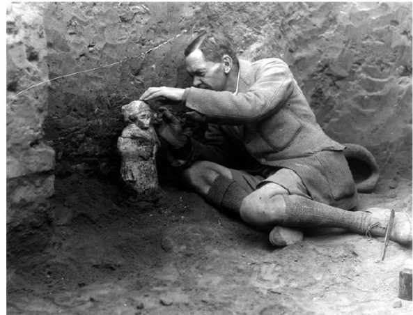
Sir Leonard Woolley (1880-1960), le plus grand archéologue d'Ur, en train d'examiner une statue votive en pierre d'un fidèle (vers 1800-1600 avant J.-C) trouvée dans un petit sanctuaire d'Hendursag dans le quartier d'Ur