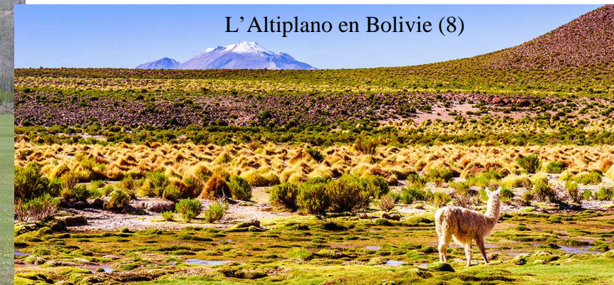
L'Altiplano en Bolivie (8)