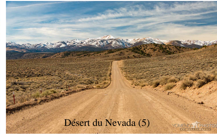
Désert du Nevada (5)