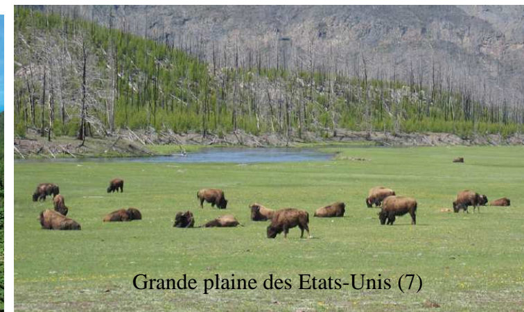
Grande plaine des Etats-Unis (7)