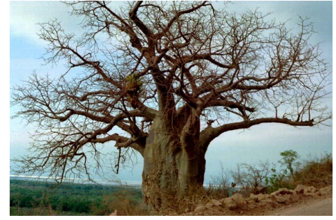
Un jeune baobab