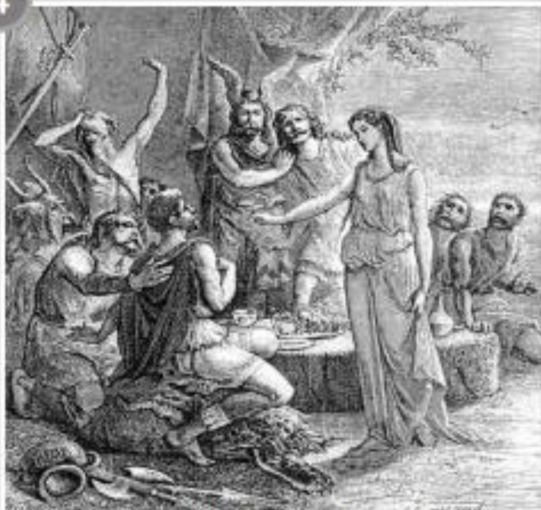
Gravure illustrant la légende de fondation de Massalia, XIX ème siècle