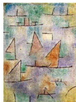
Paul Klee « Port et voiliers »