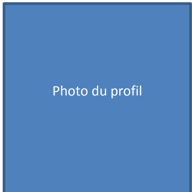
Photo du profil