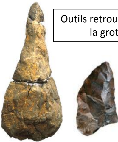
Outils retrouvés dans la grotte

Les hommes s'installaient à l'intérieur de la grotte, à une dizaine de mètres de l'entrée. Il y a une accumulation de déchets, avec des ossements dont la viande a été soigneusement raclée. On trouve aussi des extrémités de membres d'animaux dont ils devaient utiliser la fourrure : loup, lynx, renard, panthère. Au pied de la grotte, au bord de la rivière, ils devaient chasser et surprendre les animaux qui venaient boire »