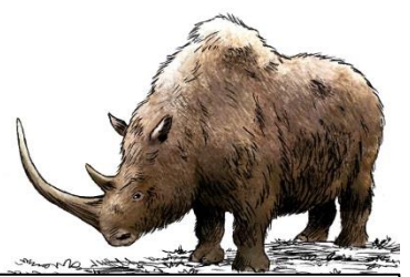
Les animaux qui vivaient dans la région de Tautavel il y a 450 000 ans.