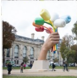
Bouquet of Tulips, Jeff Koons