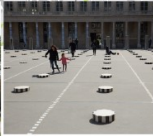
Les deux oiseaux, de Daniel Buren