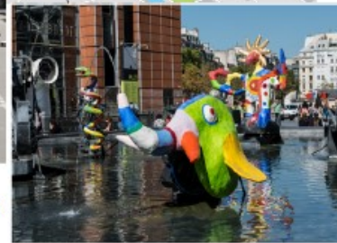
La fontaine "Statue" de Christian Boust