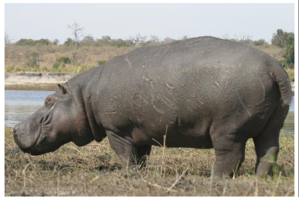
Photo dans son milieu de vie