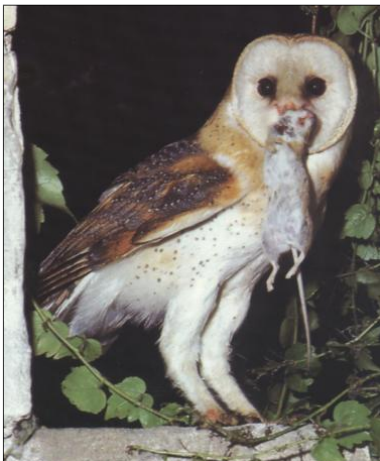
Chouette effraie avec une proie