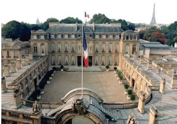
Le palais de l'Élysée

La période pendant laquelle un président est au pouvoir s'appelle un quinquennat.