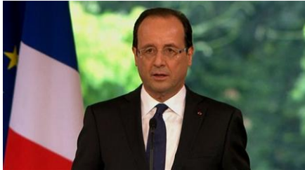
Le nouveau président de la République

En France, le président de la République est élu pour 5 ans au suffrage universel direct. Les électeurs peuvent être appelés deux fois aux urnes, dans le cas où aucun des candidats n'obtient la majorité absolue des scrutins exprimés dès le premier tour.