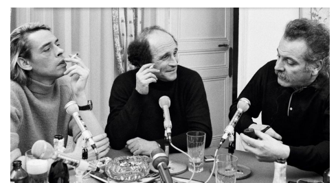
Brel, Léo Ferré et Georges Brassens