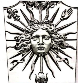
Doc. 4 Motif sur la grille d'enceinte du château de Versailles.

8. Que représente le motif sur le document 4 ?