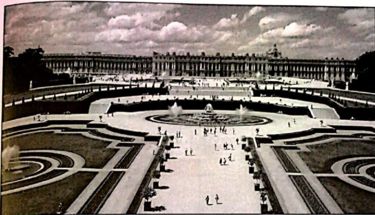
Doc. 2 Le château de Versailles et ses jardins.