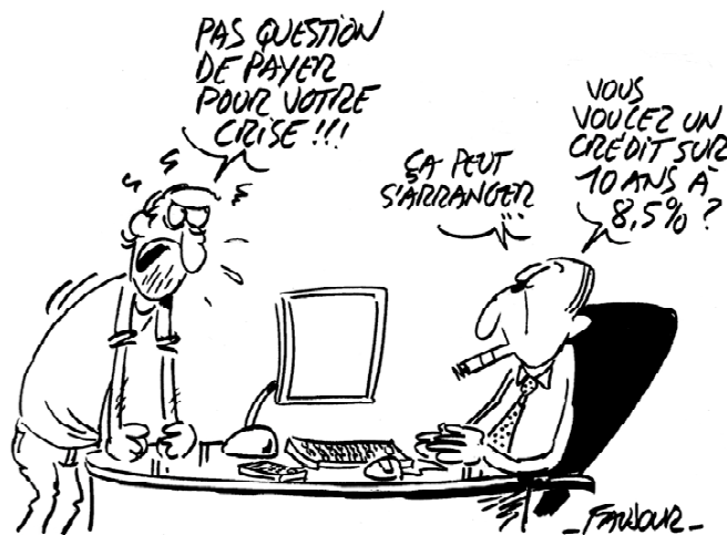
Faujour - Iconovox