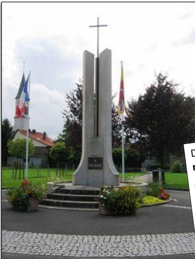
Monument aux morts de Woustviller

Dans les villes et villages, on trouve des monuments aux morts ( c'est un monument plus généralement les personnes, tuées ou disparues par faits de guerre ) qui servent à rendre hommage aux victimes de cette guerre.