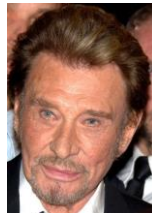
Johnny Halliday « Allumer le feu »