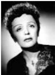
Edith PIAF « L'hymne à l'amour »