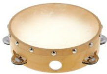
TAMBOURIN : Famille des percussions