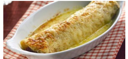
La ficelle picarde