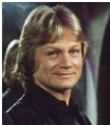
Claude François « Cette année-là »