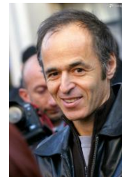
Jean Jacques Goldman « Quand la musique est bonne »