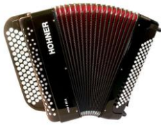
ACCORDÉON : famille des vents