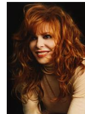
Mylène Farmer « Désenchantée »