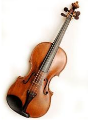
VIOLON : famille des cordes