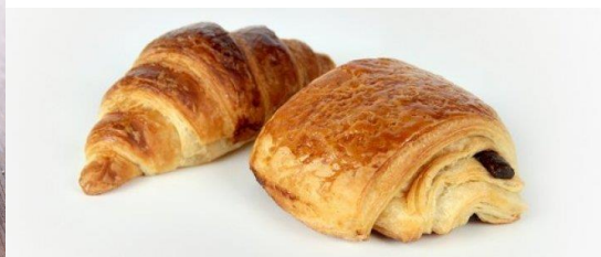
Croissant et pain au chocolat