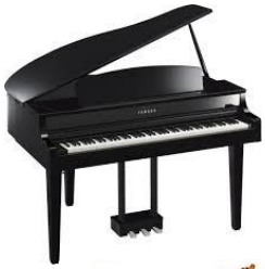
LE PIANO : Famille des claviers