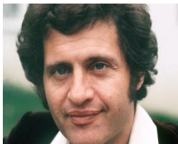
Joe Dassin « Aux champs Elysées »