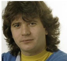
Daniel Balavoine « Le chanteur »