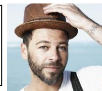
Christophe Maé « On s'attache »