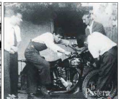
Guevara y Granado con la moto La Poderosa