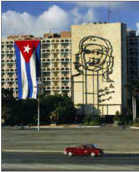
Edificio del Ministerio de Interior, La Habana

muerte violenta siendo joven , etc. Personalidades muy diversas han expresado su simpatía por él: Sartre, Perón, Maradona, Mike Tyson, el ex presidente neoliberal de Argentina Carlos Menem, Evo Morales, el líder disidente chino Leung Kwok-hung, el músico Carlos Santana, el escritor colombiano García Márquez, el líder checheno Shamil Basáyev, entre otros.