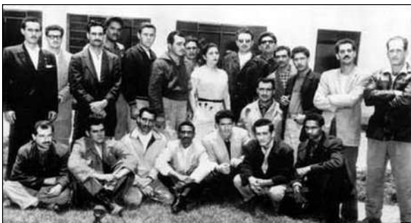
Los cubanos exiliados en México

En junio de 1955, Raúl Castro se estableció en México, desde donde los cubanos organizarían la guerrilla, y preparó la llegada de su hermano. El 7 de julio Fidel llegó a México y conoció a Guevara ; ambos congeniaron desde el primer momento. Dos semanas después le ofreció al Che unirse al Movimiento 26 de Julio .