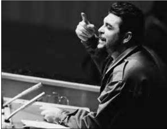
Discurso del Che en la ONU, 1964

su cargo los juicios y ejecuciones: estableció un sistema judicial con tribunales bajo su presidencia, que actuaron en audiencias públicas, con fiscales, abogados y testigos. Su opinión personal sobre los fusilamientos fue expuesta ante las Naciones Unidas el 11 de diciembre de 1964: “Nosotros tenemos que decir aquí lo que es una verdad conocida, que la hemos expresado siempre ante el mundo: fusilamientos, sí, hemos fusilado; fusilamos y seguiremos fusilando mientras sea necesario. Nuestra lucha es una lucha a muerte. Nosotros sabemos cuál sería el resultado de una batalla perdida y también tienen que saber los gusanos cuál es el resultado de la batalla perdida hoy en Cuba”.