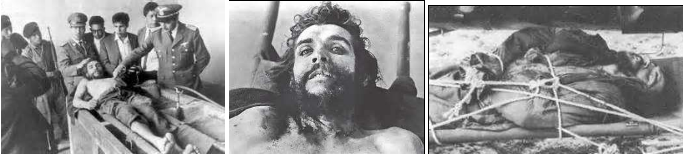
Fotos post mortem

El cuerpo permaneció 2 días en exhibición pública. Cientos de personas (soldados, aldeanos, periodistas) acudieron a verlo. Las monjas y mujeres del pueblo señalaron su parecido con Cristo y cortaron mechones de su pelo como talismanes. Los soldados y funcionarios se quedaron con cosas que llevaba al morir. Ya estaba decidido que se haría desaparecer el cuerpo: la noche del 10 de octubre de 1967 se le cortaron las manos para tomarles las huellas dactilares y conservarlas como prueba de su muerte.