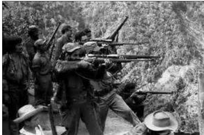
En la Sierra Maestra