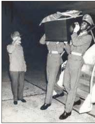
Llegada de su cuerpo a Cuba