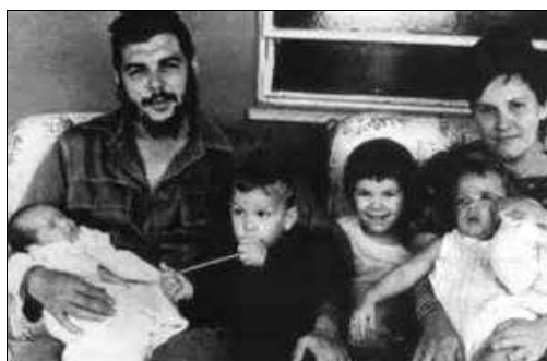
Con su esposa y sus hijos

El Che, con apoyo de Castro, decidió establecer otro foco en Bolivia, también país central de Sudamérica, bajo la dictadura del General Barrientos. En julio de 1966, el Che volvió secretamente a Cuba, donde se reunió con Fidel y los guerrilleros que lo acompañarían. Vio por última vez a sus hijos.