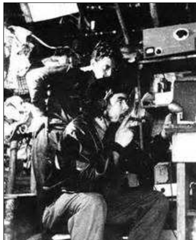
El Che emitiendo desde Radio Rebelde

Guevara integraba en sus tropas guajiros y negros, el sector más marginado del país, en un tiempo en que la segregación racial era fuerte. Uno de éstos escribió en su diario: “ Todos lo tratan con gran respeto. Es duro, seco, a veces irónico con algunos. Sus modales son suaves. Al impartir una orden se ve que manda de verdad. Se cumple en el acto ”. Con su columna, controló la zona y estableció una base donde construyó un hospital, una panadería, una armería, una zapatería y una talabartería para crear una infraestructura de apoyo. Lanzó el periódico El Cubano Libre y Radio Rebelde , que empezó a emitir en febrero de 1958 y aún existe. Impuso el orden en la región, ejecutando a los bandoleros que aprovechaban la situación para asesinar y violar mujeres, atribuyéndose la identidad de los guerrilleros. La estricta disciplina en su columna hizo que varios guerrilleros pidieran su traslado, pero su comportamiento justo e igualitario y la formación que impartía a sus hombres (desde alfabetización hasta literatura política) terminó conformando un grupo muy solidario.