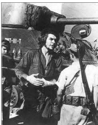
La batalla de Santa Clara

Las columnas del Che y de Cienfuegos tardaron 6 semanas en llegar al Escambray, en el centro de la isla, atravesando 600 km de zonas pantanosas. Allí el Che creó otra escuela militar, una central hidroeléctrica, un hospital, talleres y fábricas y un periódico: El Miliciano . En la Columna Ocho ubicó en los puestos clave a los hombres en que más confiaba, la mayoría provenientes de los sectores más humildes. Muchos hombres de su escolta compondrían el famoso Pelotón Suicida , encargado de las misiones difíciles.