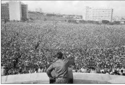
Primer discurso de La Habana, 1960

En noviembre de 1959, el Che fue nombrado Presidente del Banco Nacional. En 1960 se creó la Junta Central de Planificación (JUCEPLAN), cuyo principal promotor fue Guevara, que estableció la planificación centralizada. El Che impulsó la nacionalización de las empresas y el trabajo voluntario. Buscó también desarrollar la siderurgia para romper con la dependencia del azúcar. Viajó durante 2 meses por los países comunistas: Checoslovaquia, URSS, China, Corea y Alemania Democrática. El embajador de la URSS en Cuba lo recuerda así: “Era un personaje altamente organizado; no tenía en ese sentido nada de latinoamericano, era más bien alemán. Puntual, exacto, era asombroso para todos los que han conocido América Latina”. El viaje fue exitoso: tanto la URSS como China se comprometieron a comprar la mayor parte de la zafra. En China conoció a Mao Zedong y Zhou Enlai.