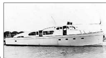
El yate Granma

El 2 de diciembre de 1956, los 82 guerrilleros desembarcaron en Cuba en el Granma y fueron derrotados por el Ejército de Batista. Se refugiaron en la Sierra Maestra donde organizaron una guerrilla.