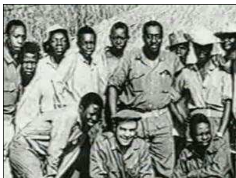
El Che en Congo

En abril llegó bajo una identidad falsa a Tanzania, desde donde se organizó el apoyo a los rebeldes. Fue una experiencia desastrosa: la falta de conocimiento del idioma y de las costumbres swahili, las múltiples fracciones de los revolucionarios, la desorganización y falta de disciplina llevaron a una derrota tras otra. En noviembre el Che, al mando de 120 cubanos, ordenó la retirada. Tres días después, Mobutu daba un golpe de Estado e instalaba una dictadura que duraría 30 años.