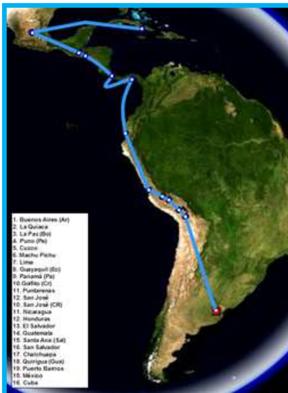
Itinerario del segundo viaje