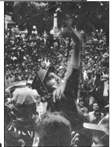
Entrada de los Barbudos en La Habana