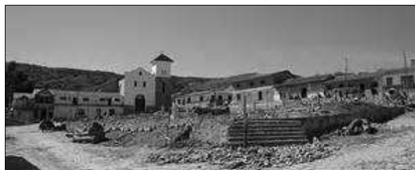
La Higuera, donde el Che fue capturado