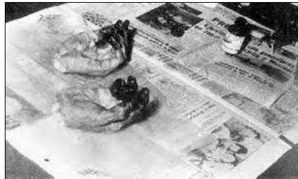
Las manos del Che

El cuerpo permaneció 2 días en exhibición pública. Cientos de personas (soldados, aldeanos, periodistas) acudieron a verlo. Las monjas y mujeres del pueblo señalaron su parecido con Cristo y cortaron mechones de su pelo como talismanes. Los soldados y funcionarios se quedaron con cosas que llevaba al morir. Ya estaba decidido que se haría desaparecer el cuerpo: la noche del 10 de octubre de 1967 se le cortaron las manos para tomarles las huellas dactilares y conservarlas como prueba de su muerte.