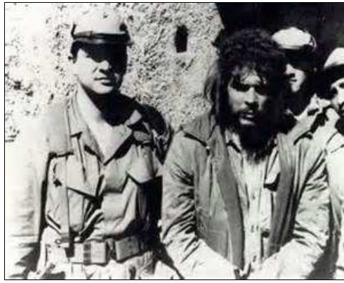
Última foto en vida