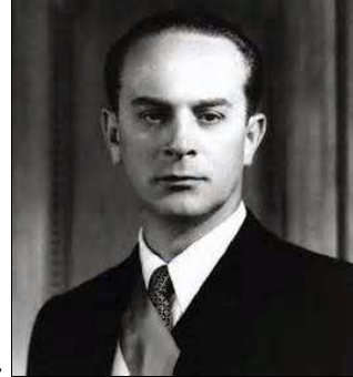
Jacobo Árbenz, presidente de Guatemala derrocado en 1954

Guevara estuvo 9 meses en Guatemala, donde la situación del Gobierno era desesperada. Se inscribió en las brigadas de sanidad y en las brigadas juveniles comunistas que patrullaban por la noche. En junio los jefes del Ejército dieron un golpe de estado y establecieron una dictadura. Ernesto se refugió en la embajada argentina, y en septiembre se fue a México. De la caída de Árbenz sacó conclusiones que luego incidieron en sus actos durante la Revolución cubana: era indispensable depurar al ejército de potenciales golpistas , pues en los momentos cruciales éstos se volvían contra el Gobierno.