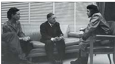
Simone de Beauvoir, Jean Paul Sartre y el Che en Cuba en 1960. Sartre escribiría después que el Che era “el ser humano más completo de nuestra época”

El Che siempre tuvo un pensamiento internacionalista. Era partidario de abrir nuevas guerrillas y pensaba que sólo generalizando la lucha armada en América Latina, Asia y África, sería posible derrotar al imperialismo. Discrepaba abiertamente con la estrategia de coexistencia pacífica que proponía la URSS. Desde el triunfo de la Revolución, el Che organizó experiencias guerrilleras en Guatemala, Nicaragua, Perú, Colombia, Venezuela y Argentina. Todas fracasaron, pero sentaron las bases de futuros movimientos guerrilleros, como el Frente Sandinista de Liberación Nacional en Nicaragua y los Tupamaros en Uruguay. Eso llevó a un enfrentamiento del Che con los partidos comunistas de América Latina, que no aprobaban la lucha armada que proponía.