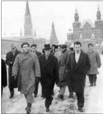
En la URSS y en China

En noviembre de 1959, el Che fue nombrado Presidente del Banco Nacional. En 1960 se creó la Junta Central de Planificación (JUCEPLAN), cuyo principal promotor fue Guevara, que estableció la planificación centralizada. El Che impulsó la nacionalización de las empresas y el trabajo voluntario. Buscó también desarrollar la siderurgia para romper con la dependencia del azúcar. Viajó durante 2 meses por los países comunistas: Checoslovaquia, URSS, China, Corea y Alemania Democrática. El embajador de la URSS en Cuba lo recuerda así: “Era un personaje altamente organizado; no tenía en ese sentido nada de latinoamericano, era más bien alemán. Puntual, exacto, era asombroso para todos los que han conocido América Latina”. El viaje fue exitoso: tanto la URSS como China se comprometieron a comprar la mayor parte de la zafra. En China conoció a Mao Zedong y Zhou Enlai.