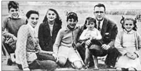
La familia Guevara

Ernesto Guevara fue el mayor de los 5 hijos de Ernesto Guevara y Celia de la Serna, de clase media alta. Su madre perteneció a una generación de mujeres progresistas que promovieron el feminismo, la libertad sexual y la autonomía de las mujeres. Los padres de Ernesto se separaron en 1948, aunque siguieron viviendo bajo el mismo techo, conducta inhabitual en aquella época.