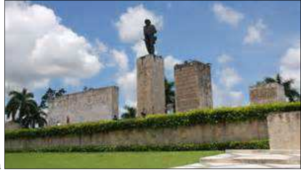
Memorial de Santa Clara