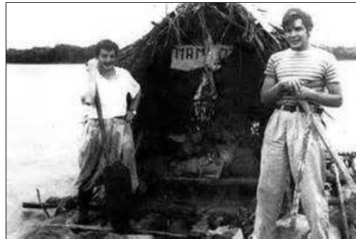
En la balsa Mambo-Tango

En una balsa llamada Mambo-Tango prosiguieron su viaje y llegaron a la frontera de Colombia. Volaron a Bogotá. En bus se dirigieron a Caracas, Venezuela, donde Granado obtuvo empleo en un leprosoario. Ernesto debía terminar sus estudios, por eso decidió volver en un avión que hacía escala en Miami, donde trabajó de empleado doméstico. El 31 de julio de 1952 volvió a Buenos Aires. Finalizó sus estudios de medicina en la Universidad Nacional y en abril de 1953 recibió el título de médico.