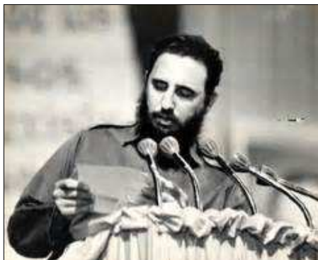
Fidel lee la carta de despedida del Che

A finales de 1964, el Che decidió dejar el gobierno para encabezar tropas cubanas que apoyarían otros movimientos revolucionarios. Congo, donde Lumumba había sido asesinado en 1961 con participación de la CIA y donde actuaba una guerrilla rebelde, le pareció una causa apropiada. En el centro de África, se le aparecía como un foco desde el que se podría irradiar la revolución a todo el continente. A principios de 1965 le escribió una carta a Fidel renunciando a todos sus cargos y anunciando su partida hacia “nuevos campos de batalla”, firmando con la frase “ hasta la victoria siempre ”. Leída por Castro durante el Primer Congreso del PCC y retransmitida en televisión, causó sensación por el mundo. Para entonces, el Che había desaparecido de la vida pública y su paradero era desconocido.