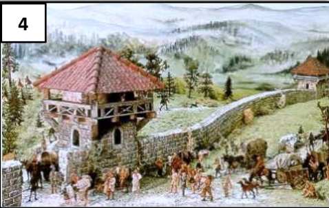
Dessin d'une tour de guet