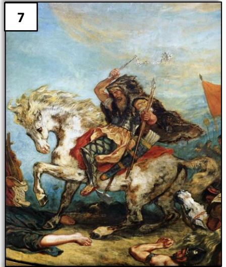
Attila, roi des Huns. Détail d'une fresque peinte par E. Delacroix.

A quoi l'auteur compare-t-il les attaques barbares ?