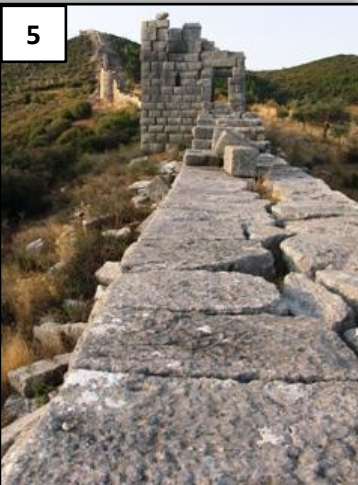
Une frontière fortifiée par les romains.