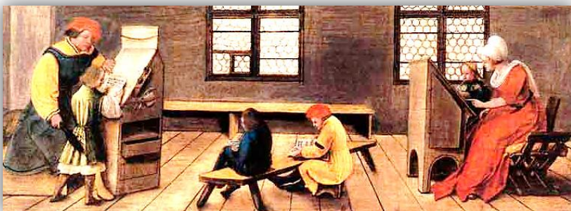
Doc 3 : Une leçon de lecture au 16 ème siècle.

Des savants font de nouvelles découvertes. Ambroise Paré révolutionne la chirurgie en découvrant comment ligaturer les artères.