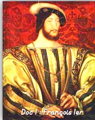
Doc 1 : François 1 er

Que tient le maître dans la main droite ? Il tient un fouet