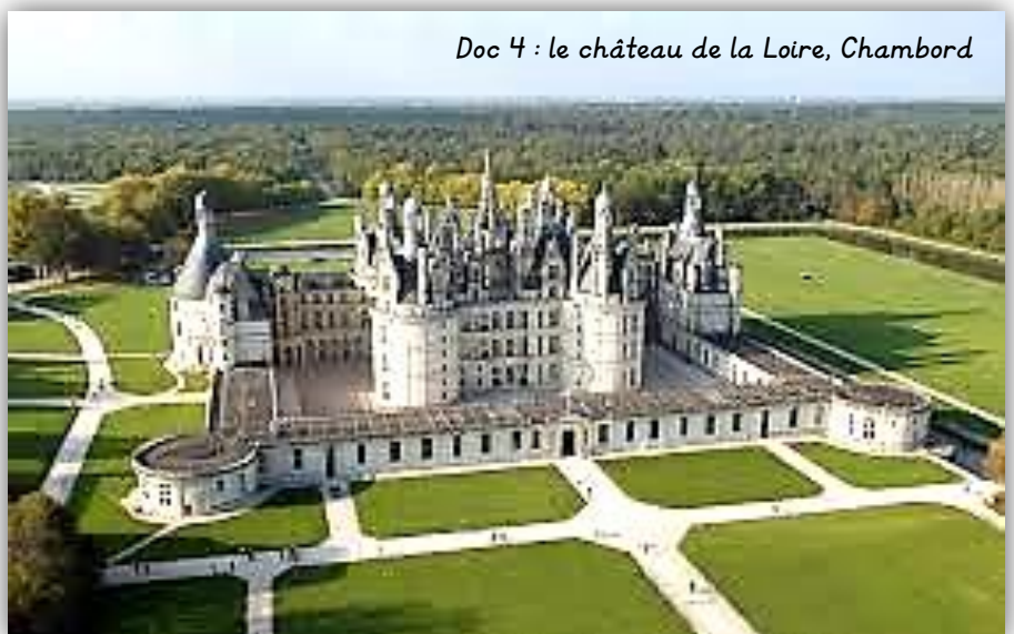
Doc 4 : le château de la Loire, Chambord

Le château de Chambord, construit sous François I er , comprend 440 chambres et 365 cheminées. Le parc comprend aujourd'hui 5 500 hectares de bois fermés par un mur de 32 kilomètres de long.