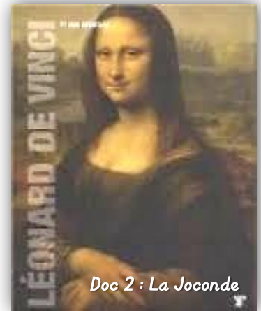
Doc 2 : La Joconde