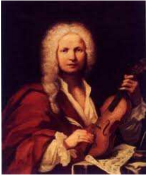
"Les quatre saisons" - "L'Automne"