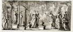
PERSEE, TRAGEDIE PROLOGUE