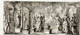
PERSEE, TRAGEDIE. PROLOGUE.