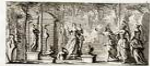
PERSEE, TRAGEDIE. PROLOGUE.