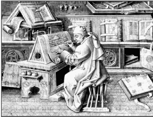
↑ Un moine copiste recopie un manuscrit car l'imprimerie n'existe pas encore.